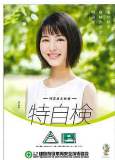
2020年イメージキャラクター 浜辺美波さん