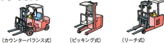
(カウンターバランス式) (ピッキング式) (リーチ式)