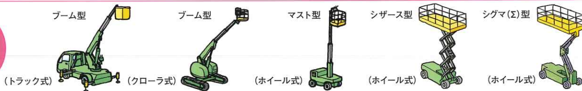
ブーム型 (トラック式) (クローラ式) (ホイール式) シザーズ型 (ホイール式) シグマ(Σ)型 (ホイール式)