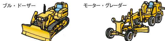
ブル・ドーザー モーター・グレーダー (クローラ式) (ホイール式)