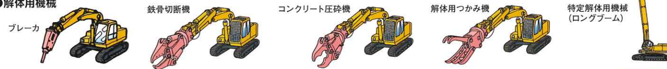
ブレーカ 鉄骨切断機 コンクリート圧砕機 解体用つかみ機 特定解体用機械(ロングブーム)